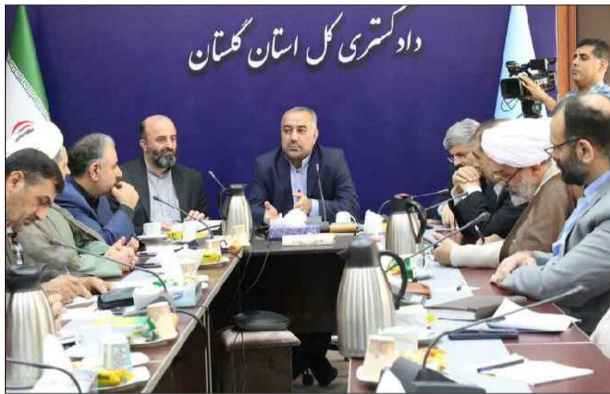
دادگستری کل استان گلستان

مهر: رئیس کل دادگستری گلستان گفت: تاکنون پرونده تخلف انتخاباتی در استان نداشته‌ایم و بیشتر گزارش‌ها مبنی بر تبلیغات برخی منافضیان به صورت مخفی و خانوادگی است. حیدر آسبایی در پنجمین جلسه ستاد پیشگیری و رسیدگی به جرایم و تخلفات انتخاباتی استان از معرفی نمایندگان حقوقی به هیئت‌های اجرایی خبر داد و اظهار کرد: این نمایندگان در راستای اجرای ماده ۳۸ قانون انتخابات تعیین شدند که بیشتر آنها داستان هستند. وی از ممنوعیت استفاده از امکانات عمومی برای تبلیغات نامدها خبر داد. آسبایی با اشاره به ادامه رصد و پایش فعالیت‌های منافضیان نمایندگی در انتخابات پیش رو، گفت: تاکنون پرونده تخلف انتخاباتی در استان نداشته‌ایم و