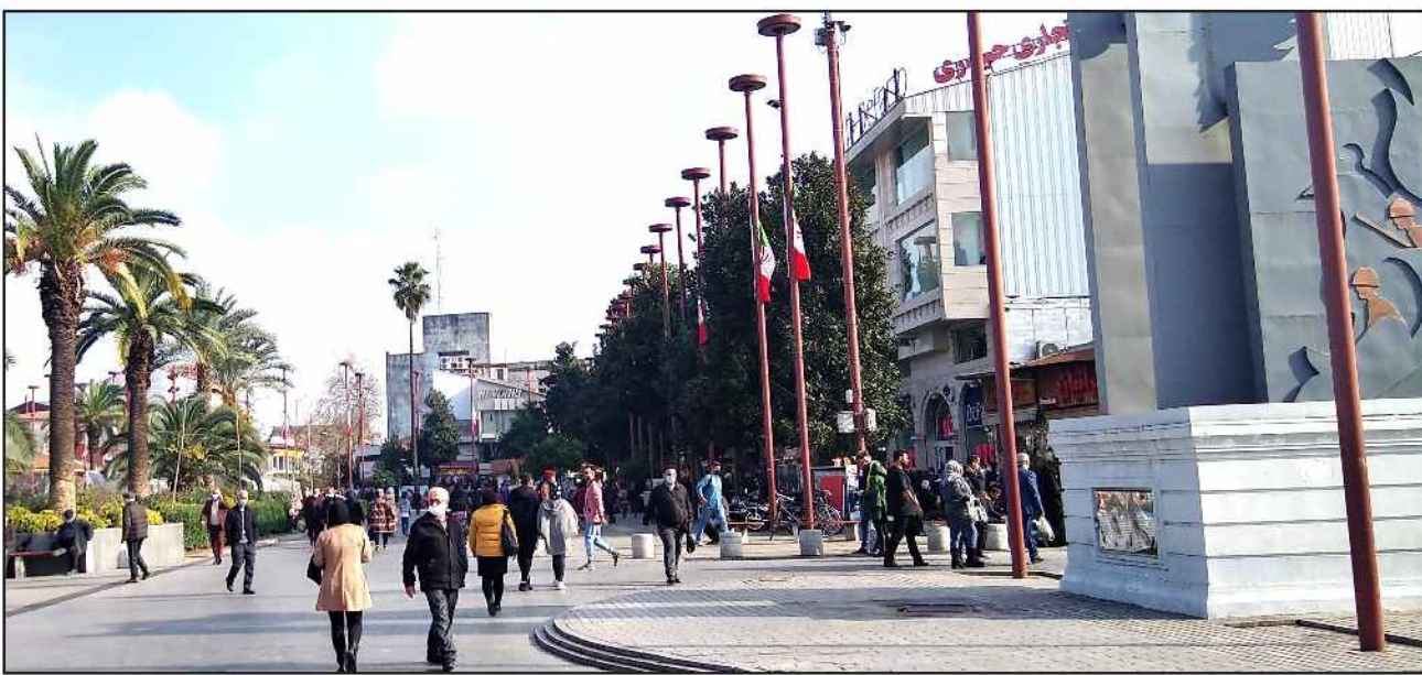
شهردار رشت در جریان بازدید از فضای سبز و فضای باز پارک آسایش شهروندان در اولویت برنامه های شهرداری رشت است

آسایش شهروندان در اولویت برنامه های شهرداری رشت است