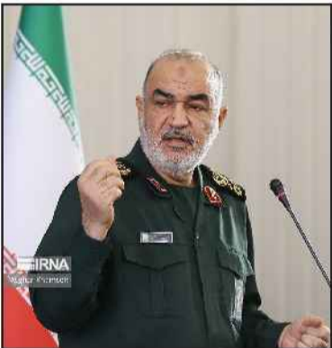
مسیر بدون توقف در حال جریان است.

ایرنا: فرمانده کل سپاه پاسداران انقلاب اسلامی عملیات طوفان الاقصی را اولین مرحله از فروپاشی زودرس رژیم جعلی صهیونیستی توصیف و تأکید کرد: امروز هویت جعلی این رژیم فرو ریخته و جز یک پوسته توخالی چیز دیگری از آنها باقی نمانده است. سردار سرلشکر پاسدار حسین سلامی در اولین همایش سراسری طرح و برنامه‌ریزی راهبردی سپاه با گرامیداشت یاد و خاطره امام زاهد و شهیدی والا مقام انقلاب اسلامی، دفاع مقدس، امنیت و امت اسلامی اظهار داشت: امنیت، شکوه و اقتدار امروز ما نشأت گرفته از خون‌های پاک شهید و مجاهدانی است که در این مسیر نورانی ایثارگرانه از جان گذشتند تا آرزوهای یک امت بزرگ را حلق کنند.