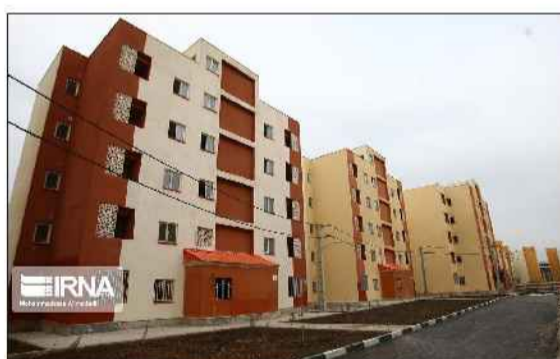
شهرستان سوادکوه ۲۵۰ متقاضی داریم که به خاطر محدودیت جدی زمین توانستیم در چند ماه گذشته ساخت مسکن را آغاز کنیم. اما تا تامین چند قطعه زمین عملیات اجرایی ۳۰ واحد امروز آغاز شد و در آینده نزدیک نیز ساخت چندین واحد دیگر آغاز می شود.

شهروبر اسفال همزمان با افتتاح همزمان ۱۰۰ هزار واحد مسکونی با حضور ویدئو کنفرانسی رئیس جمهور، کلید چهار هزار و ۲۹۰ واحد مسکونی طرح نهضت ملی مسکن در مازندران به مردم و مناقضیان واجد شرایط تحویل داده شد.