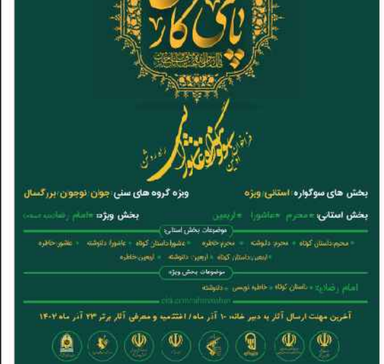
بخش های سوگواره استانی ویژه: ویژه گروه های سنی جوان نوجوان بزرگسال

مراسم اختتامیه و معرفی آثار برتر این سوگواره در تاریخ ۲۳ آذر ماه ۱۴۰۲ برگزار می شود.