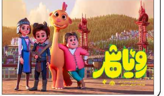
پس از اکران موفق انیمیشن سینمایی «لوپونو» که در شرایط کم رونقی سینماها توانست به فروش خوبی دست پیدا کند و همچنین کسب جوایز «مسافری از گانور» در جشنواره فیلم های کودکان و نوجوانان که به زودی راهی اکران خواهد شد، «رویا شاهر» سومین اثر مرکز انیمیشن سوره است که برای حضور احتمالی در جشنواره فیلم فجر آماده خواهد شد.