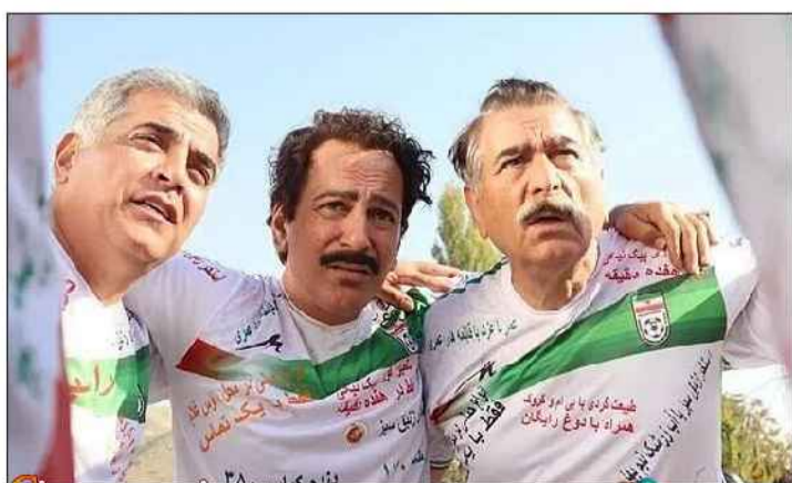
سال های ۱۳۹۸، ۱۳۹۹، ۱۴۰۰ و ۱۴۰۲ از شبکه یک و شبکه تماشا پخش شدند.