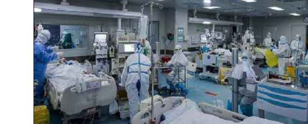
بیمار کرونایی در مراکز درمانی گلستان بستری هستند.

گفتنی است در استان گلستان بیش از ۷ هزار نفر شتر وجود دارد که حدود ۳ هزار نفر آن در شهرستان گنبد کاووس پرورش می‌یابند.