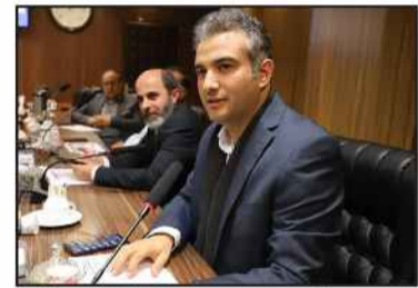
رئیس کمیسیون توسعه پایدار افزود: چگونه است با حمایت های مالی متعدد هنوز هم دو ورزشگاه اصلی شهر از داشتن بدیهات و آرایه ابتدایی ترین خدمات محروم است. ما شان شهروند

رشت و آنان که به تماشای مسابقات می روند را بیش از این می‌دانیم که بر سکوی سیمانی و یا صندلی های شکسته نشسته و زیر بارش باران و یا در آفتاب سوزان از تیم خود حمایت کنند. عضو شورای شهر در انتها گفت: یک بار برای همیشه در این باره تصمیمی متفاوت بگیریم و برای رشت ارزش افزوده ایجاد کنیم. پیشنهاد میکنم طی جلسه ای با حضور مدیرکل ورزش و جوانان و نیز مدیران دو باشگاه سپیدرود و داماش تمهیدی اتخاذ کنیم تا با رفع قایض نسبت بازسازی ورزشگاه عضدی در قالب یک ورزشگاه مسقف مدرن هشت هزار نفره اقدام لازم و مناسب با نام رشت انجام پذیرد.