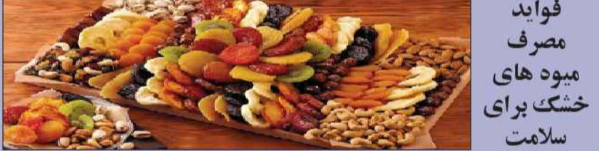
فواید مصرف میوه‌های خشک برای سلامت

به گفته محققان میوه‌های خشک منبع سالم تری از مواد مغذی و کالری‌ها هستند. محققان دانشکده پزشکی هاروارد عنوان می‌کنند در برخی موارد مصرف برخی میوه‌های خشک حتی از میوه تازه هم سالم تر است. معمولاً میوه‌های خشک در مقایسه با میوه‌های تازه، فیبر و آنتی‌اکسیدان‌های بیشتری دارند. تحقیقات نشان داده است که فیبر و آنتی‌اکسیدان‌ها با بیماری‌های قلبی، چاقی و سرطان مبارزه می‌کنند. محققان دانشگاه هاروارد تأکید می‌کنند که توجه به رچسب میوه‌های خشک از لحاظ میزان مغذی مهم است و باید از مصرف میوه‌های خشک حاوی مواد قندی خودداری نمود.