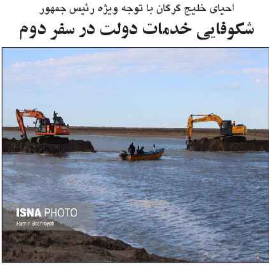
احیای خلیج گرگان با توجه ویژه رئیس جمهور شکوفایی خدمات دولت در سفر دوم

ایسنا: مدیر بنادر و دریانوردی گلستان با بیان اینکه در آستانه سفر دوم رئیس جمهور به استان، شاهد بازگشایی کانال آشوراده و آبگیری خلیج گرگان هستیم، افزود: سفر دوم دولت به گلستان بستر شکوفایی خدمات سفر اول خواهد بود. نورالله عباسی ره آورد سفر نخست آیت الله ابراهیم رئیسی به استان گلستان را بسیار ارزشمند و نجات بخش خلیج بحرآزاده گرگان دانست و اظهار کرد: پس از پیگیری مستمر مجموعه استانداری و بازدید رئیس جمهور و تعدادی از وزرای دولت از خلیج گرگان در سفر نخست، اقدامات شایسته‌ای توسط سازمان بنادر و دریانوردی برای علاج بخشی و احیای خلیج گرگان انجام شد. وی با بیان اینکه در دریانوردی لایروبی خلیج، بالغ بر یک میلیون و ۴۲۰ هزار مترمکعب گل و لای برداشت شده است، ادامه داد: قبل از اجرای عملیات علاج بخشی، شوری آب خلیج به ۴۸ میلی گرم در هزار افزایش یافته بود که بعد از احیا و بازگشایی کانال آشور، شوری آب به ۲۷ میلی گرم در هزار رسیده و ۲۱ میلی گرم در هزار از آن کاسته شده است.