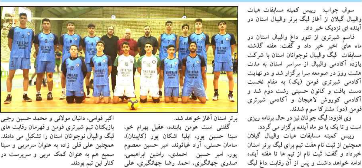
سوال جواب: رئیس کمیته مسابقات هیات والیبال گیلان از آغاز لیگ برتر والیبال استان در آینده ای نزدیک خبر داد.