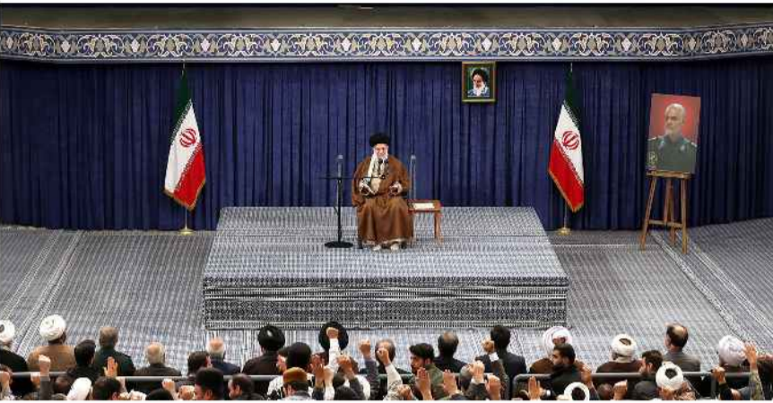
انتخابات محقق می‌شود.

آیت‌الله خامنه‌ای همه کسانی که در جامعه مخاطب دارند از جمله علمای اعلام، استادان دانشگاه و حوزه، صدوسیما و مطبوعات را به دعوت از مردم برای مشارکت در انتخابات فراخواندند و افزودند: جوانان و اعضای خانواده‌ها نیز مخاطبان خود را به برگزاری انتخاباتی پرشور تشویق کنند.