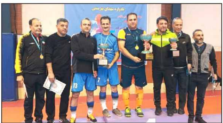
سوال جواب: تیم فوتسال بهیستی گیلان در آخرین مسابقات کارکنان بهیستی کشور، نایب قهرمانی رسید.

دیدار از مسابقات کارکنان بهیستی کشور، با شکست برابر تیم بهیستی اصفهان، به مقام نایب قهرمانی رسید. در بیست و ششمین دوره از مسابقات کارکنان بهیستی کشور(باداروه شهدای بهیستی) که به میزبانی استان مازندران در شهریارکسر برگزار شد، تیم فوتسال بهیستی گیلان پس از رقابتی تنگاتنگ با حریفان در نهایت توانست مقام نایب قهرمانی را از آن خود کند.