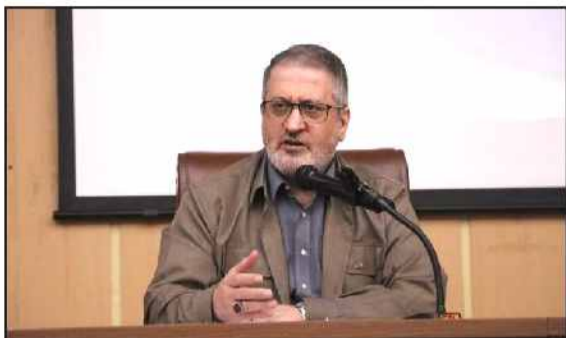
جلایی برگزارهای نشست‌های مستمر انتخابات را هماهنگی و آمادگی برای برگزاری یک انتخابات

احراز هویت رأی دهندگان انتخابات الکترونیکی انجام می‌شود