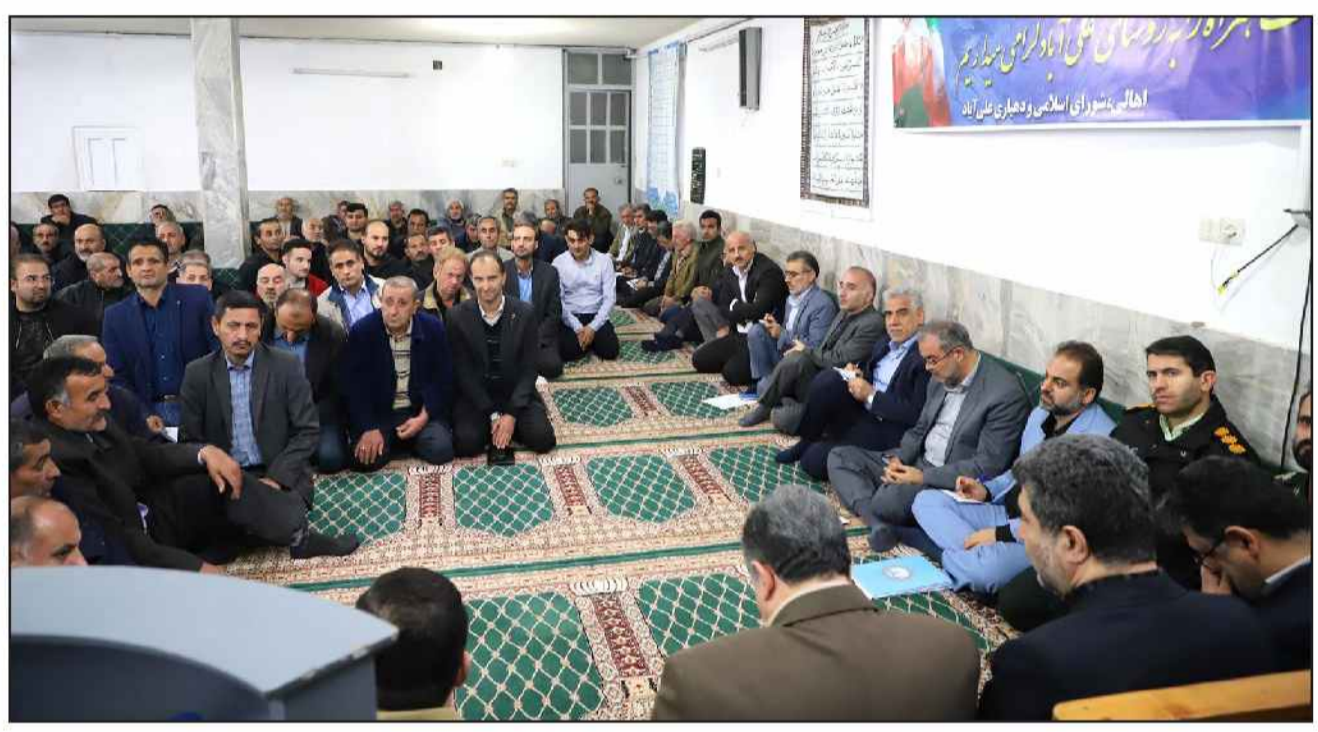
استاندار گیلان در جمع صمیمی مردم علی آباد رودبار: