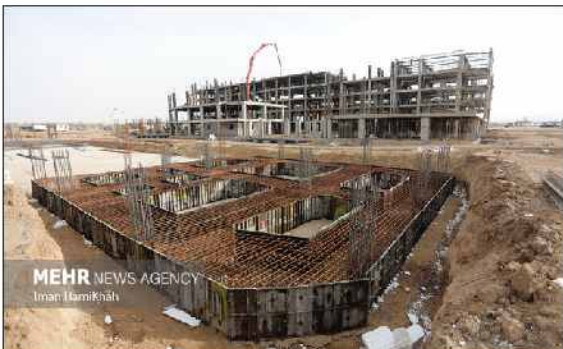
مرتبه سازی را رونق بخشیم. وی ادامه داد: ساختمانها و شهرکهای ما باید پیوسته و ساز داشته باشیم، گفت: باید بلند