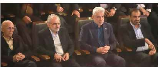
رئیس کل دادگستری کیلان: