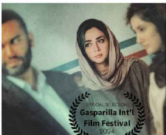
صدا برداری: شاهین پورداداشی، دستیار یک کارگردان و برنامه ریز: توفیق حیدری، منشی صحنه: سپیده کریهخانی، طرح صحنه: علی خیری، طرح لباس: نگار راجیان، طرح چهره پردازی: مهناز محوی، مدیر تولید: مرتضی ابراهیمی، عکاس: رامین جهانپانی.

تدوین: شیدا گرجی، صداگذاری: شاهین پورداداشی، اصلاح رنگ: نور، فانسز نظیری، دستیار دو کارگردان: میلاد حسینی، دستیار یک فیلمبردار: محمد آقا حسینی، دستیاران فیلمبردار: رضا حسینی، میلاد جعفرآبادی، سالار حاتمی و محمدرضا احمدی، ایراتور دوربین: امیرحسین پناهی، دستیار صدا: مهدی، دستیاران: علی رضایی، دستیار گیم: مسعود غنی آبادی، دستیار تولید: موسی باقریان، مدیر تدارکات: علیرضا احمدی، دستیار تدارکات: آرمن شیرگیر، ترجمه: سپیده خلیلی، زیرنویس: رضا تاوردی، طرح پوستر: هانیه فریدونی، مشاور رسانه‌ای: آزاده فضلی، پخش بین الملل: سولماز اعتماد.