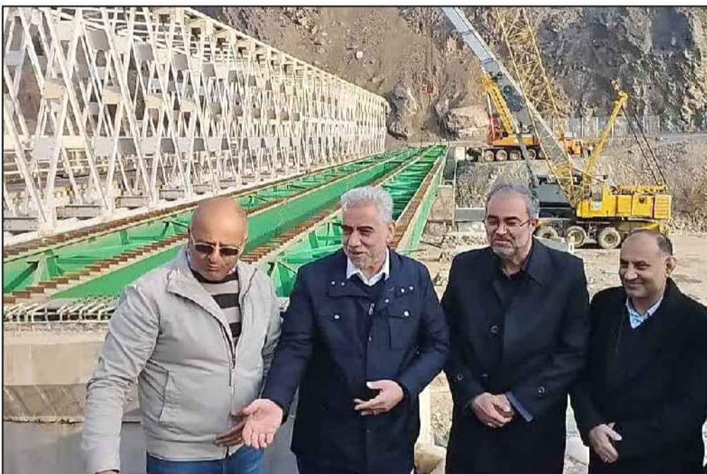
مدیرکل راه و شهرسازی کیلان خبر داد:

پیشرفت ۸۵ درصدی پل در دست ساخت سفیدرود رودبار