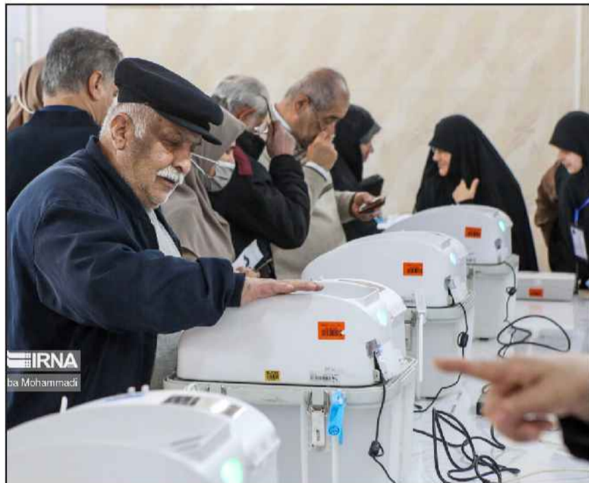
IRNA با Mohammad

محمداقبر نوبخت کاندیدای انتخابات مجلس دوازدهم از حوزه انتخابیه رشت و خمام پس از رای نیاوردن در انتخابات روز جمعه ۱۱ اسفندماه طی پیامی در شبکه اجتماعی ایکس (توییتر سابق) خطاب به مردم رشت نوشت: «پیامی به مردم فهمم زادگاه خودم... در تاریخ بهمانند نگران شما بودم، آدمم، همه شما نیامدید همچنان نگران، ولی با وجدانی آسوده، برگشتم، خدای مهربان نگهدارتان».