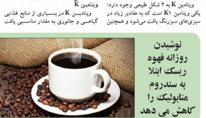
نوشیدن روزانه قهوه ریسک ابتلا به سندروم متابولیک را کاهش می‌دهد

طبق گزارش محققان، نوشیدن ۱ تا ۴ فنجان قهوه در روز موجب کاهش ریسک سندروم متابولیک می‌شود. گزارش محققان نشان می‌دهد مصرف قهوه در کاهش ریسک ابتلا به سندروم متابولیک که خطر مشکلات قلبی عروقی نظیر بیماری قلبی عروقی، کرونر و سکته را افزایش می‌دهد، نقش دارد. محققان دریافته‌اند پلی فنول‌های