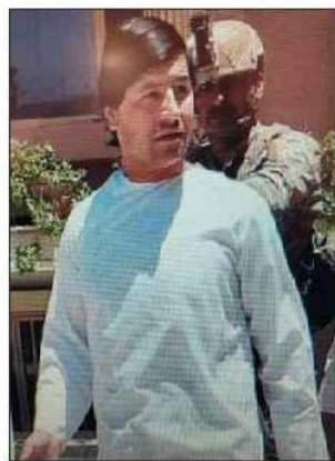
فرماندهی انتظامی استان البرز خبر داد.

سخنگوی پلیس از اجرای عملیات گسترده واحد ضد تروریسم سازمان اطلاعات فراجا و دستگیری چندین عضو گروهک تروریستی داعش خبر داد.