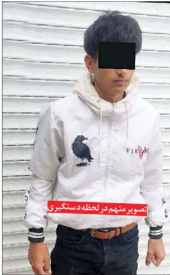
تصویر منم در لحظه دستگیری

پسر ۱۷ ساله که خواهرش را به قتل رسانده است، می‌گوید برای جلوگیری از بدنامی دست به این جنایت زد. راز قتل زن ۲۳ ساله مطلقه، هنگامی روی تخت کالبدشکافی پزشکی قانونی مشهود فاش شد که حکایت عجیب و تاسف بار آن به ماجرای خواهرکشی برای جلوگیری از «بدنامی» گره خورد. روزنامه خراسان نوشت: صبح روز پنج شنبه گذشته (ششم اردیبهشت) جسد زن جوانی روی تخت کالبدشکافی قرار گرفت که برای تعیین علت مرگ از بیمارستان طالقانی به پزشکی قانونی مشهد انتقال یافته بود. با آن که آثار اقدامات درمانی خاصی روی جسد دیده نمی‌شد و احتمال مرگ زن ۲۳ ساله قبل از انتقال به بیمارستان وجود داشت اما خانواده وی در حالی که مدعی بودند او به مرگ طبیعی جان باخته است، اصرار داشتند تا زودتر جسد را برای خاک سپاری تحویل بگیرند! در همین حال دکتر رضازاده (رئیس سالن تشریح پزشکی قانونی) که به ماجرای مرگ این زن جوان مشکوک شده بود برای بررسی‌های دقیق‌تر در روند کالبدشکافی وارد سالن تشریح شد اما هنوز کادر پزشکی مشغول فراهم آوردن مقدمات کالبدشکافی بودند که ناگهان رئیس سالن تشریح براساس تجربیات پزشکی خود رنگه‌هایی از جنایت در زیر گلوئی زن جوان مشاهده کرد چراکه آثار بسیار ظریفی از اسناد راه تنفسی بر این فرضیه جنایتی مهر تایید می‌زد. گزارش روزنامه خراسان حاکی است لحظاتی بعد پزشک قانونی در تماس تلفنی با قاضی ویژه قتل عمد مشهد از وقوع جنایتی هولناک خبر داد که آثار انکارناپذیر آن روی تخت کالبدشکافی نمایان شده بود بنابراین طولی نکشید که قاضی دکتر صادق صفری به همراه گروهی از افسران کارآموزه پلیس آگاهی