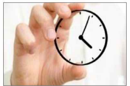
نتایج یک مطالعه نشان می دهد برای دست یافتن به سلامتی مطلوب باید روزی چهار ساعت را به درجاتی از فعالیت بدنی اختصاص دهید.

فعالیت بدنی متوسط تا شدید می تواند پیاده روی سریع یا دوچرخه سواری باشد یا دویدن آهسته، برای فعالیت بدنی سبک هم می توان هر فعالیتی از پیاده روی گرفته تا آشپزی و کار خانه یا حتی خندیدن با صدای بلند را به فهرست افزود. به گزارش ایندپندنت، گروه تحقیقاتی دانشگاه سوبینرین به