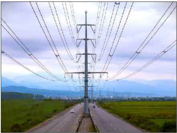
است که از آن جمله می‌توان به احداث خط چهارم مداره ۱۱ کیلوولت به طول ۳۶ کیلومتر مدار، احداث خطوط ۳۳۰ و ۶۳ کیلوولت روستا - محمودآباد و توسعه خطوط ۶۳ کیلوولت در مناطق فیدونکنار، ساری، تنکابن و محمودآباد اشاره کرد.

۱۵۰ میلیارد تومان و احداث فاز نخست پست ۶۳/۲۰ کیلوولت کتاب بابل با ظرفیت ۳۰ مگاوات آبر اشاره کرد. مدیرعامل شرکت برق منطقه‌ای مازندران و گلستان ادامه داد: احداث خطوط انتقال و فوق توزیع از دیگر برنامه‌های مهم این شرکت