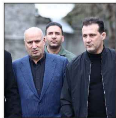
رئیس فدراسیون دربارۀ عقب نشینی رئیس جمهور آمریکا از توثیت اولیه اش درباره میزبانی

جام جهانی گفت: ترامپ دیروز ابتدا یک پیام گذاشت و مطالبی را عنوان کرد که نقض و خلاف بدیهی‌ترین شرایط میزبانی مسابقات ورزشی، چون جام جهانی است. او خودش به روشنی امنیت برگزاری مسابقات و میزبانی کشورش را زیر سوال برد که این امنیت می‌بایست هم از طرف میزبان هم برقرار کننده تا مین باشد. تاج افزود: این اظهارات ناشایه از سر نادانی بود و سبیل و قبیله واکتس‌های جهانی را دید عقب نشینی کرد. البته این تغییر نگرش و این رفتارها چیزی است که از او برمی آید و نشان می‌دهد اساساً استراتژی ندارد و این موضوعی است که در روزهای اخیر بارها و بارها در رسانه‌های مختلف حتی در رسانه‌های آمریکایی هم منتشر شده است. فدراسیون فوتبال، اما با یک پلن مشخص حتی در شرایط امروز برنامه‌ها را پیش می‌برد و در برنامه جایگزین برنامه ریزی‌هایی برای برگزاری مسابقات دوستانه فروردین ماه به شکلی جدید در حال تدارک است که مراحل مربوط به آن در حال نهایی شدن است.