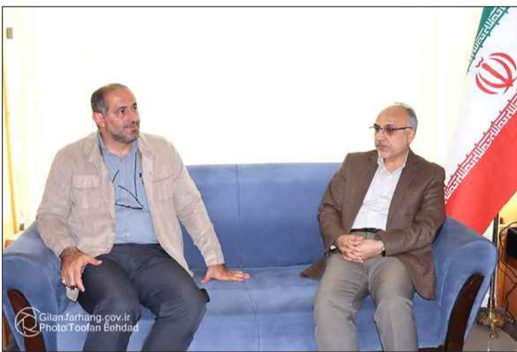
مدیرکل فرهنگ و ارشاد اسلامی در دیدار با نماینده آستانرا عنوان کرد.

ارشاد اسلامی استان گیلان، نقش فرهنگ و هنر را در ارتقای سرمایه اجتماعی، تقویت انسجام ملی و هدایت افکار عمومی بسیار مهم ارزیابی کرد.